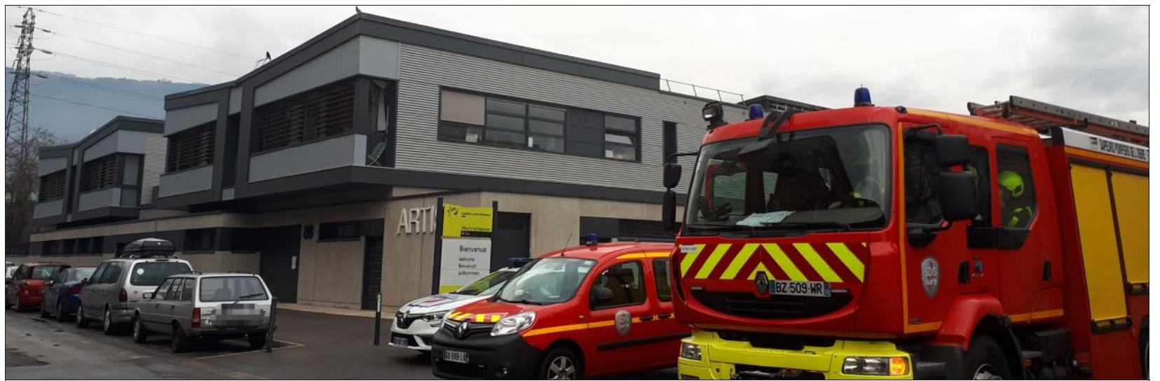
Ce dimanche matin, alors que les stigmates des violences des derniers jours étaient encore visibles, le bâtiment incendié était placé sous la surveillance des sapeurs-pompiers et de la police.

MEYLAN Sur le mur d'une école ce dimanche