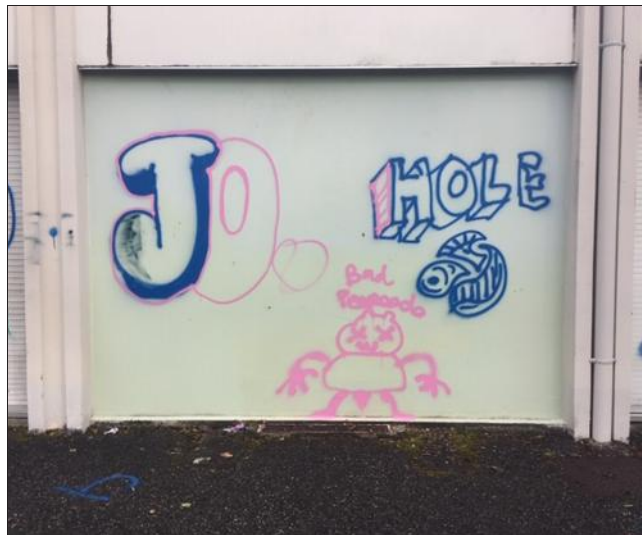
Les tags réalisés ce dimanche par deux adolescents.

Ils ont été interpellés en flagrant délit par les gendarmes de la communauté de brigades de Meylan. Deux adolescents domiciliés à Meylan ont été surpris en train de réaliser des tags sur un mur de l'école primaire située allée du Brêt à Meylan