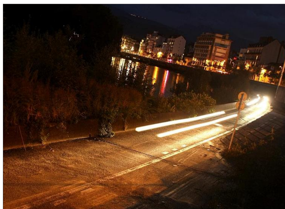
Ce soir, la commune - avec le concours de GEG - va couper l'éclairage public entre 21 heures et 22 h 30 sur le secteur 2 et le parc Paul-Mistral.