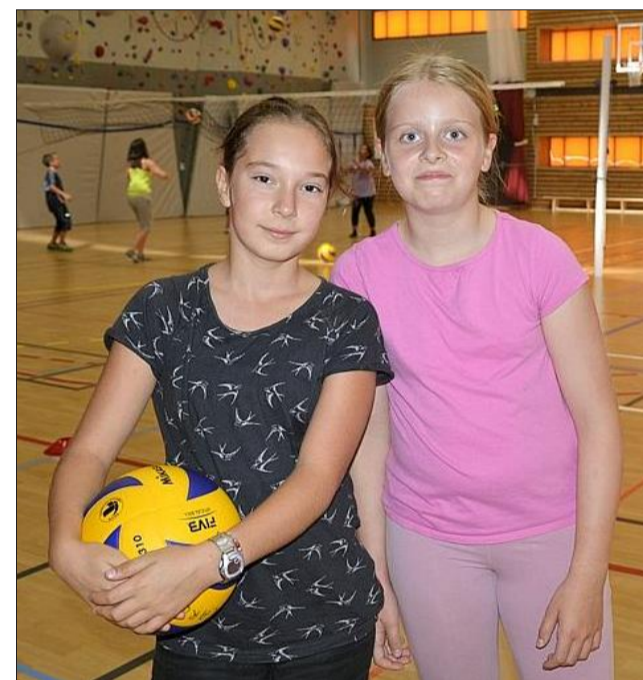
Parmi les sports proposés : le volley-ball.