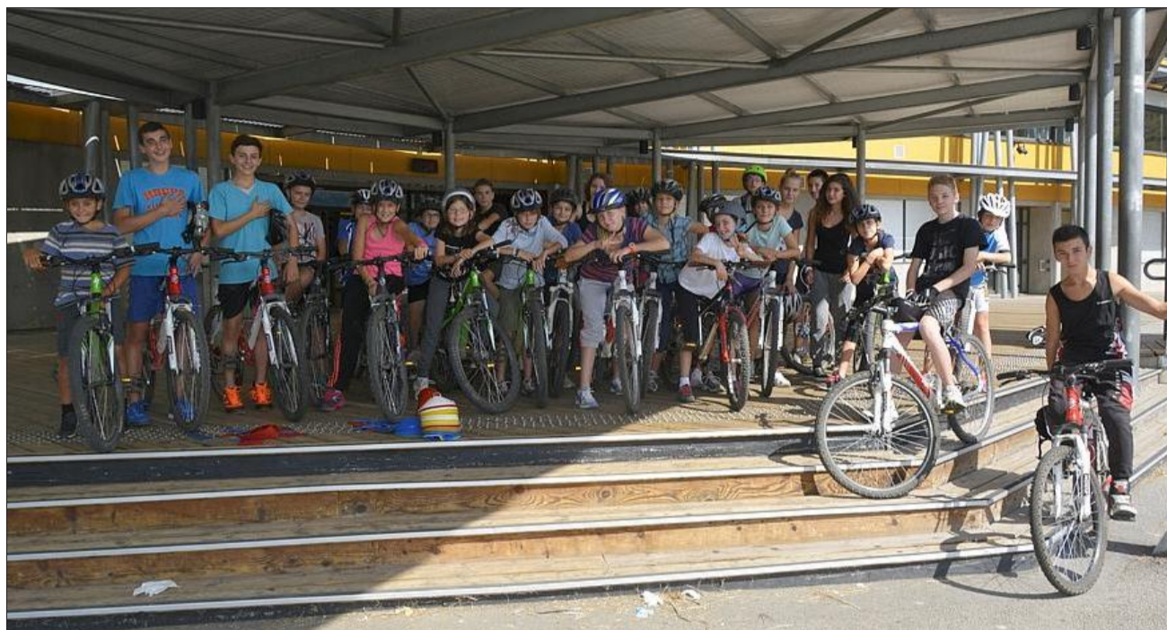
Le VTT est porteur de très bons résultats sur le collège. La première épreuve aura lieu début octobre.