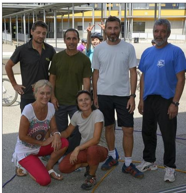
Les professeurs d'éducation physique et sportive de l'établissement encadrent la section UNSS.