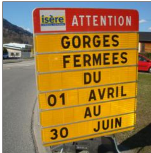
La route des Gorges du Bréda est fermée à la circulation jusqu'au 29 juin.

Les travaux ont repris début avril sur la RD 525, Allevard - La Rochette et ils sont prévus jusqu'au 30 juin. Pendant cette période (3 mois), les Gorges du Breda sont coupées totalement à la circulation. Les déviations habituelles sont mises en place. À savoir au départ d'Allevard : par la Chapelle-du-Bard, avant le pont de la Noue, pour rejoindre Arvillard et La Rochette (Savoie) et par la route du Moutaret pour rejoindre Saint-Maximin et Pontcharra. Une signalétique des itinéraires de déviation est mise en place sur ces routes RD209-RD202 et RD9. Le chantier en cours consiste au confortement des murs de soutènement et à la reprise des dispositifs de retenue. Une première phase de travaux avait eu lieu à l'automne dernier : le pont de la Noue avait alors été élargi. Au total, le coût de ces travaux s'élève à 3,8 millions d'euros.