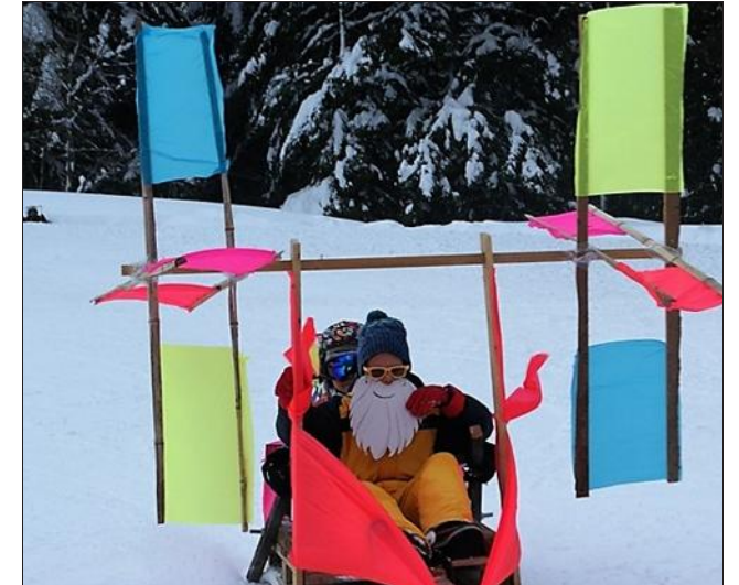
Le 3 février dernier, la petite station du Plateau des Petites-Roches fêtait ses 50 ans. Pour assurer sa pérennité, elle mise sur un espace ludique ouvert été comme hiver, afin de ne pas subir le manque d'enneigement.

Le Col de Marcieu, à 1 066 m d'altitude, garde néanmoins cette "météo dépendance" qui peut le fragiliser. Ainsi, après avoir conforté l'élément neige, « on travaille sur des activités complémentaires (une tyrolienne à virage arrive cet été, NDLR) avec cette idée de proposer l'espace ludique en hiver lors de périodes compliquées en matière d'enneigement en profi-