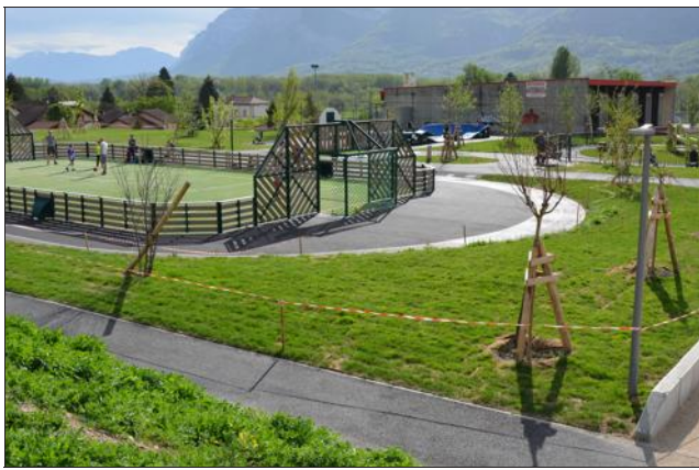
L'engazonnement du parc désormais terminé, les habitants peuvent venir profiter des jeux.

Le parc de jeux communal, situé aux abords des écoles du village, révèle enfin sa vraie nature. La municipalité peut se targuer de proposer un espace parfaitement adapté à toutes les familles. Pour flâner, s'amuser, faire du sport, papoter, les Goncelinois savent où se retrouver. Tout a été pensé pour que chacun passe du bon temps. Qu'ils soient tout petits dans les jeux enfantins, autour de la petite piste de course pour les plus grands, sur les modules de skate pour les adolescents ou sur le city stade pour les adultes, les distractions sont nombreuses et le bien-être omniprésent. Le nouveau parc de jeux a fière allure, et tout est bientôt terminé, l'entreprise EVD ayant dernièrement réalisé l'engazonnement du parc. La municipalité invite tous les Goncelinois à s'amuser, espérant que tous les utilisateurs respectent l'espace.