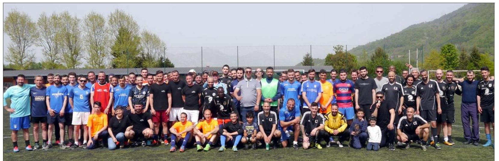
Dix équipes se sont affrontées sur le stade dans une belle ambiance.

Un tournoi de football inter-entreprises s'est déroulé lundi au stade. Organisé par le comité social et économi-