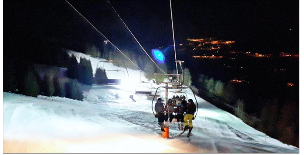
Les soirées ski nocturne du Collet d'Allevard ont été un vrai succès.