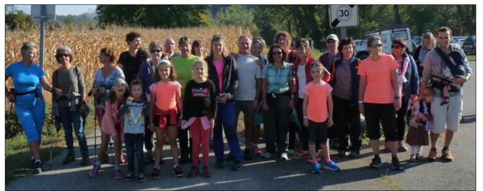
Départ de la marche.

Dimanche, les parents d'élèves de "Vive l'école" et les 60 bénévoles qui ont oeuvré pour le premier trail à Saint-Maximin sont ravis du bilan. Ils comptaient sur 150 participants : ils étaient 179 !