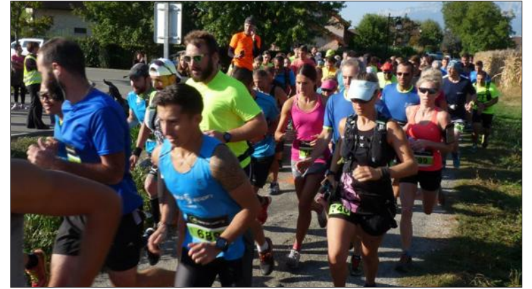
Départ du 10 km.