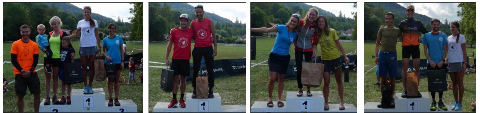
De gauche à droite : le podium des 10 km femmes, 16 km hommes, 16 km femmes et 10 km hommes.

Pour récompenser le maximum de trailers, les classements se sont faits d'abord avec les 3 premiers de chaque course, puis sur dix catégories pour chaque course.