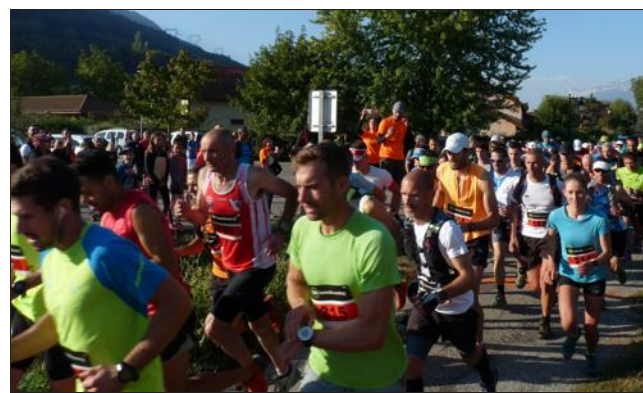
Départ du 16 km.