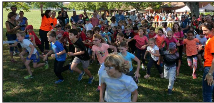
Départ de la course enfant.