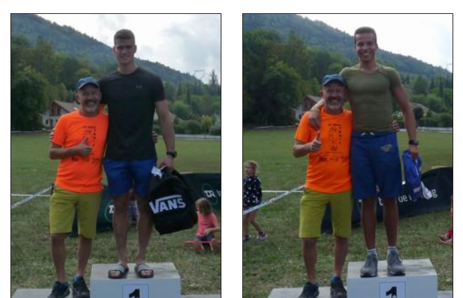
De gauche à droite : le podium espoir des 16 km hommes et des 10 km hommes.