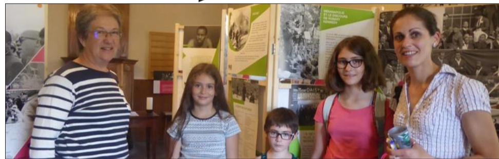
L'exposition sur Martin Luther King se veut pédagogique et d'actualité... 50 ans après.

Les Amis du Temple d'Allevard vous proposent, cet été, et jusque fin septembre, une exposition au temple sur "Martin Luther King, 50 ans après", tous les vendredis après-midi de 15 h à 18 h 30. Le 4 avril 1968, Martin