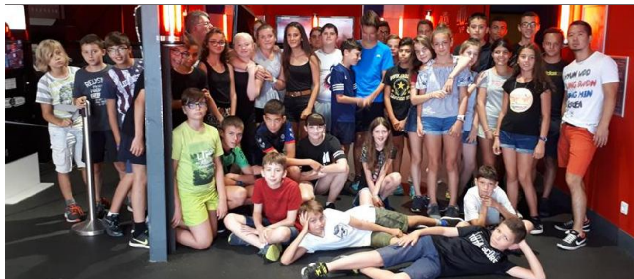
Trente-six jeunes ont pu profiter d'un Laser game, lundi dernier, grâce au centre de loisir.