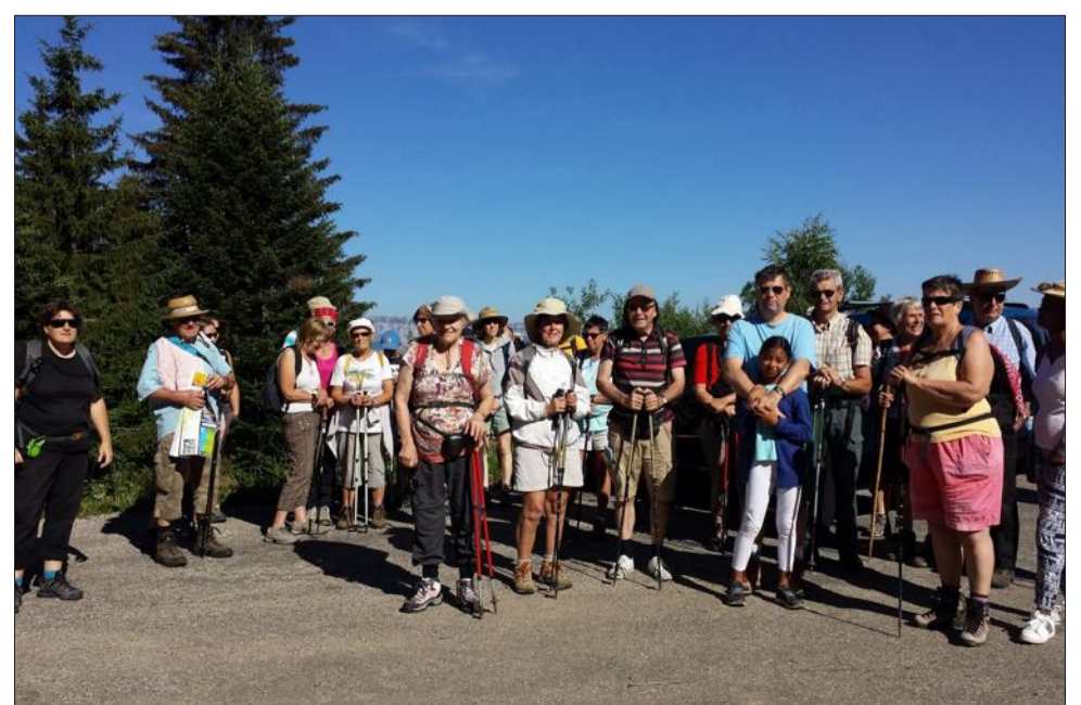
Les randonneurs sont partis du foyer de fond du Barioz pour rejoindre le site des Tavernes.

Après 40 minutes de descente, les randonneurs se quittent, les jambes un peu lourdes mais la tête pleine d'images magnifiques et de belles rencontres.