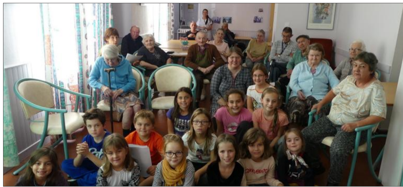
Après leur tour de chant, les enfants ont partagé un goûter avec les résidents.

Les enfants de la section LTAP chants se sont rendus ce lundi au foyer logement pour passer un instant musical avec les aînés du village.