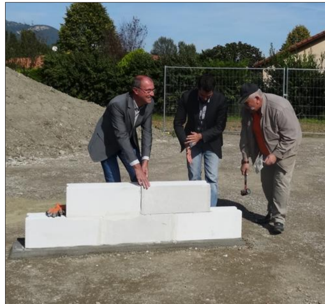
Les premières pierres de la résidence ont été symboliquement posées ce vendredi.