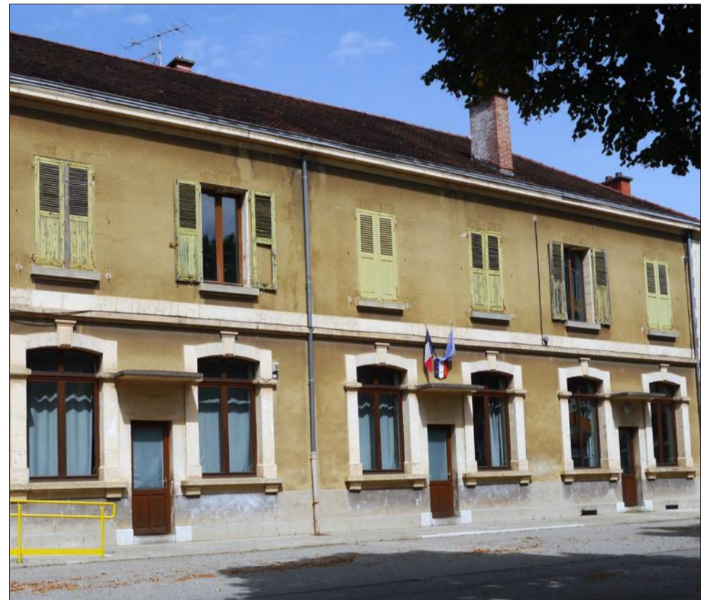
395 enfants rejoindront l'école César-Terrier, la plus ancienne de la commune.

La municipalité a mené une réflexion sur les groupes scolaires. Elle annoncera les orientations futures lors d'une réunion publique le 14 septembre à 20 heures au Coléo.