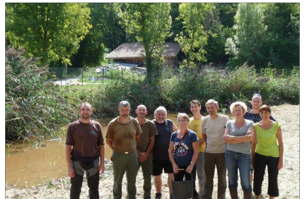
Habitants et représentants de diverses associations ont participé à cette opération de sauvetage.