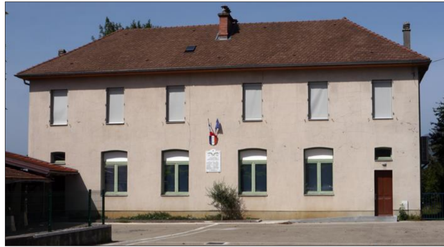
343 enfants sont inscrits à l'école de Villard-Noir, rue de Bramefarine.