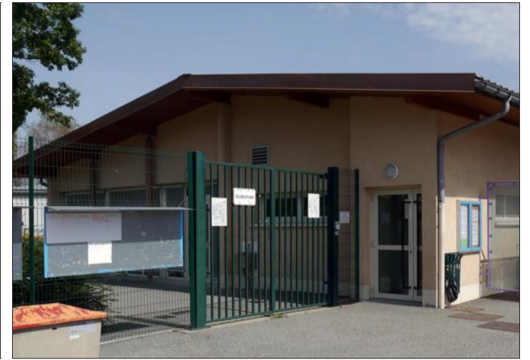
L'école primaire de Villard-Benoit accueillera 43 élèves.

Le principal changement pour les écoliers charraonnais est le retour à la semaine de quatre jours. La décision votée en conseil municipal en juillet dernier, fait suite à une consultation des parents d'élèves qui s'y sont montrés favorables à plus de 75 %.