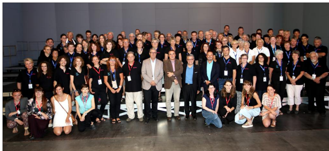
Chaque année, des dizaines de volontaires œuvrent pour faire du festival un événement (ici lors de l'édition 2016).

L'association les Amis du Festival Berlioz, qui coordonne les bénévoles de la manifestation, a démarré le recrutement pour cette édition 2017.