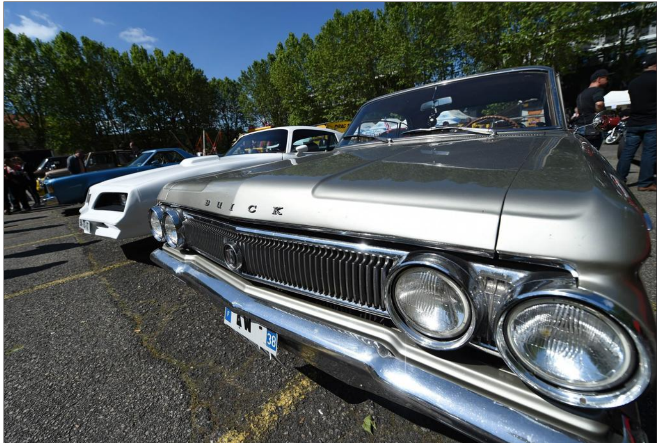
Au moins 150 belles américaines à quatre roues attendent les visiteurs le dimanche 4 juin.

Il y aura également des shows plus hot ! Dans tous les sens du terme. À 16 h et