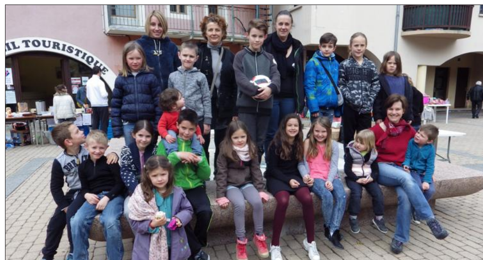
Dimanche, sur la place de l'Europe les parents d'élèves du Sou des écoles publiques ont organisé la braderie des enfants. Les profits des diverses manifestations proposées par le Sou des écoles vont permettre de financer, en partie, les activités des élèves comme la récente classe de découverte à Tence en Haute-Loire.