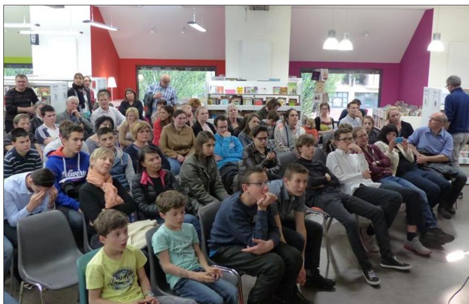
Mardi soir, s'est tenu le vernissage de l'exposition "En bas vu d'en haut".