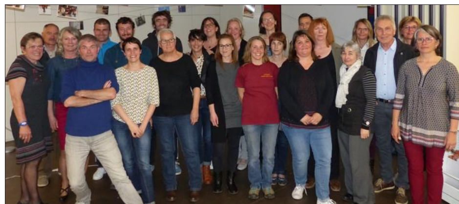
Le comité d'action culturelle du Val Gelon regroupe l'association "Bien Vivre en Val Gelon", la médiathèque, l'établissement d'hébergement des personnes âgées dépendantes "Les Curtines", l'école de La Neuve, le centre de loisirs intercommunal, l'école de musique et la fondation OVE. Le projet a reçu le soutien de la Rochette, de la communauté de communes Cœur de Savoie et du département.