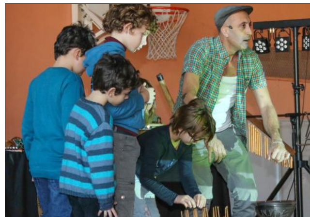
Quelques écoliers ont pu tester les instruments de Momo Solo.