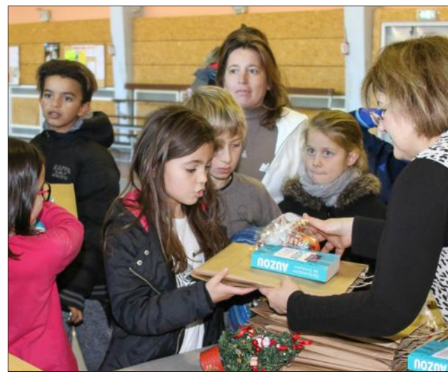
Des livres et des dictionnaires pour les CP et les CM.

Cette année, le spectacle de magie avait laissé place à un spectacle pédagogique et humoristique présenté par Momo Solo, un artiste aux multiples facettes, musicien dans l'âme.